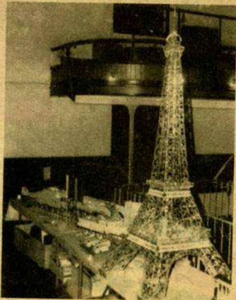
Des heures et des heures de patience