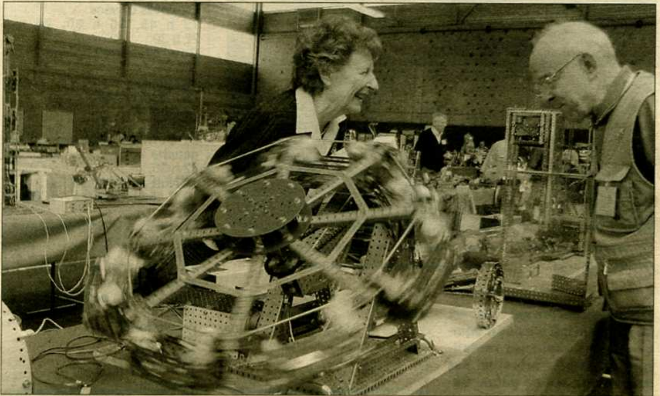
Cette expo montre de très belles maquettes réalisées avec des boîtes de Meccano.

Tous les plus de quarante ans connaissent le Meccano, ce jeu autrefois célèbre. Ces fans ont rendez-vous à Aniche, jusqu'à samedi, pour voir les prouesses que les passionnés sont capables de réaliser.