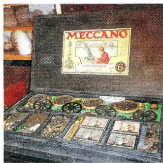
Les boîtes anciennes de Meccano® et leur contenu sont de petits trésors.

Fils d'une institutrice et d'un contrôleur puis inspecteur des impôts, le Bernayen, devenu professeur de mathématiques et d'informatique au lycée Fresnel se souvient encore de la boîte de Meccano® reçue un jour de Noël. Tout comme les trains électriques, ce jeu créatif fait alors partie des cadeaux tra-