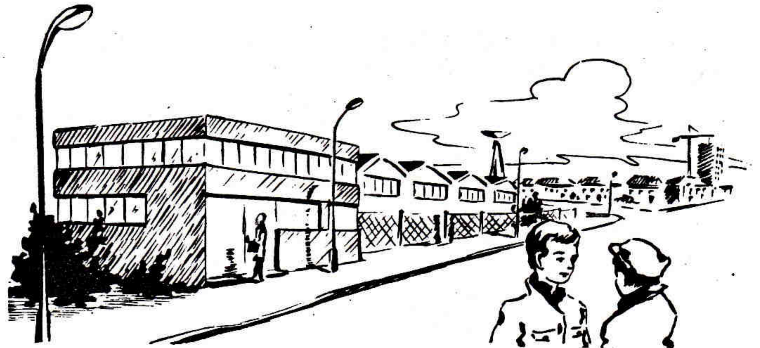
Figure 1. — De vastes bâtiments, parfois une cheminée, un château d'eau : une usine

Les observations se feront en plusieurs étapes, que vous pourrez effectuer tout le long de l'année scolaire, selon les occasions : il n'y a même pas nécessité absolue de respecter l'ordre des enquêtes proposé par la fiche.