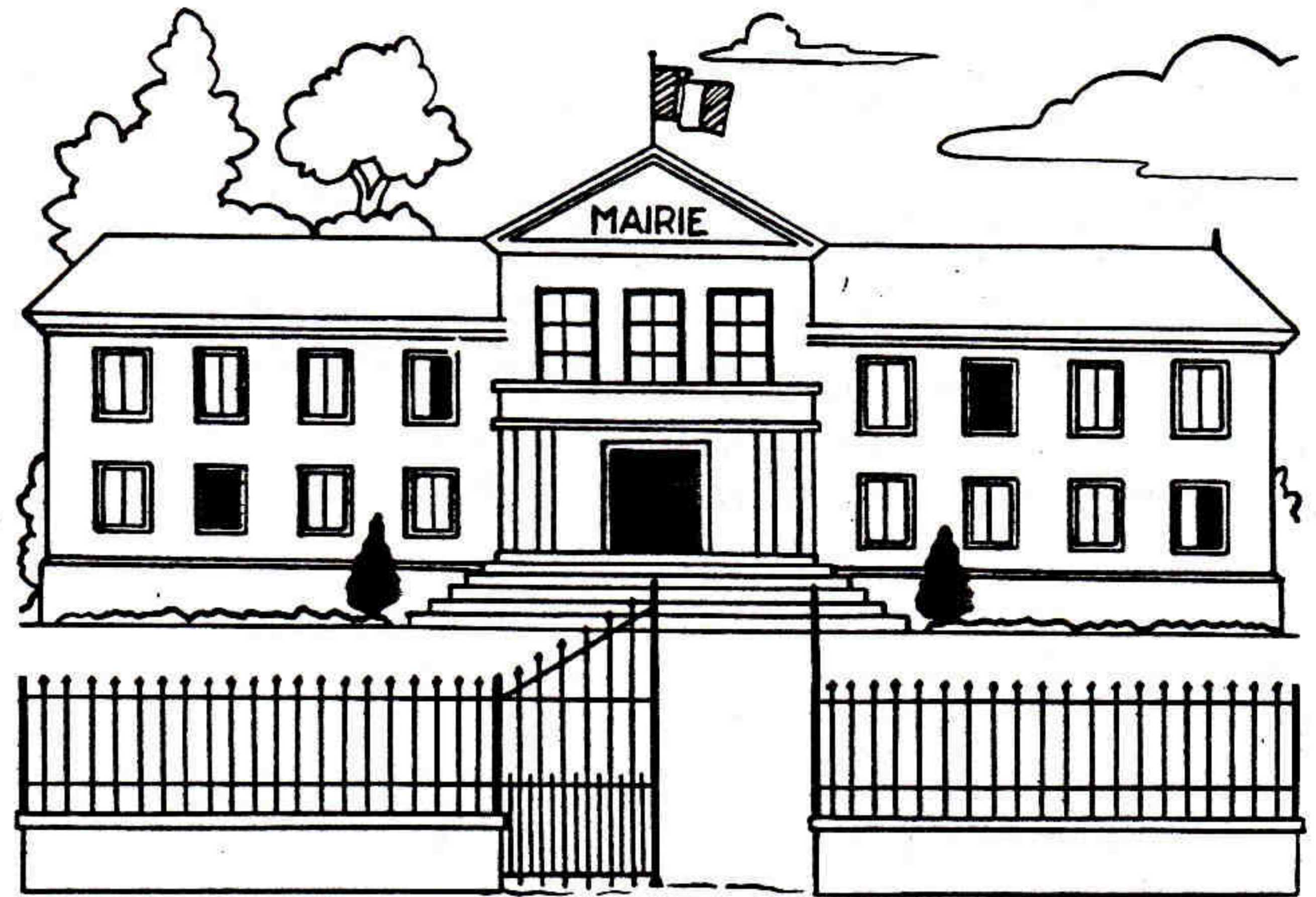
Figure 1. — La mairie est le centre administratif de la commune.

Vous appartenez à bien d'autres groupes humains. Ainsi vous habitez sur le territoire d'une commune : commune urbaine ou rurale, ou mixte, commune très peuplée ou à faible densité de population..., et vous avez également une place parmi les habitants de cette commune.