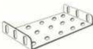
PLAQUES À REBORDS 51 - 6 x 4 cm 53 - 9 x 6 cm