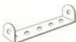
BANDES COUDEES 45 - 38 x 12 mm 48 a - 60 x 12 mm