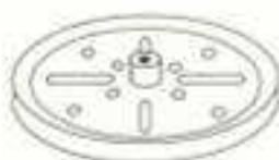
ROUE À MOYEU \varnothing 75 mm 19 b

15 - long. 13 cm 16 - long. 9 cm 15 a - long. 11,5 cm 16 b - long. 7,5 cm 15 b - long. 10 cm 17 - long. 5 cm