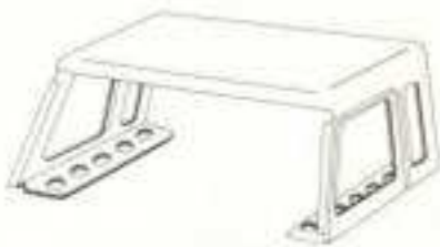
CABINE SUPÉRIEURE 300