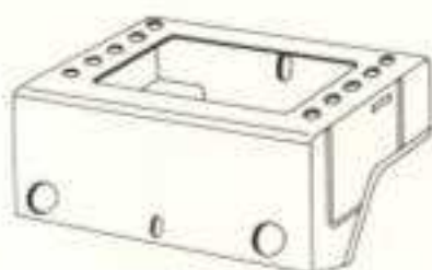
CABINE INFÉRIEURE 300 a