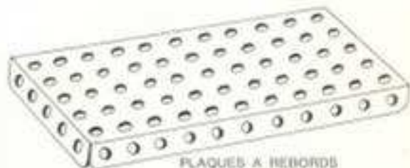
PLAQUES À REBORDS 52 - 14 x 6 cm