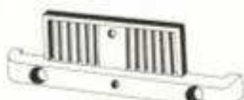
CALANDRE 300 d