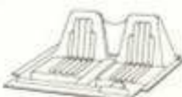
SIÈGE 300 e