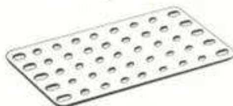
PLAQUES SANS REBORDS 53 a - 11,5 x 6 cm 70 - 14 x 6 cm