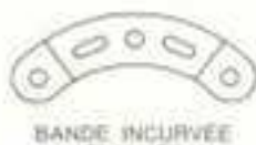
BANDE INCURVÉE ÉPAULÉE 90 a