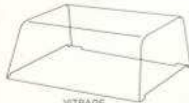
VITRAGE 300 b