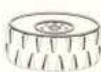
ROUE DE CANON 301