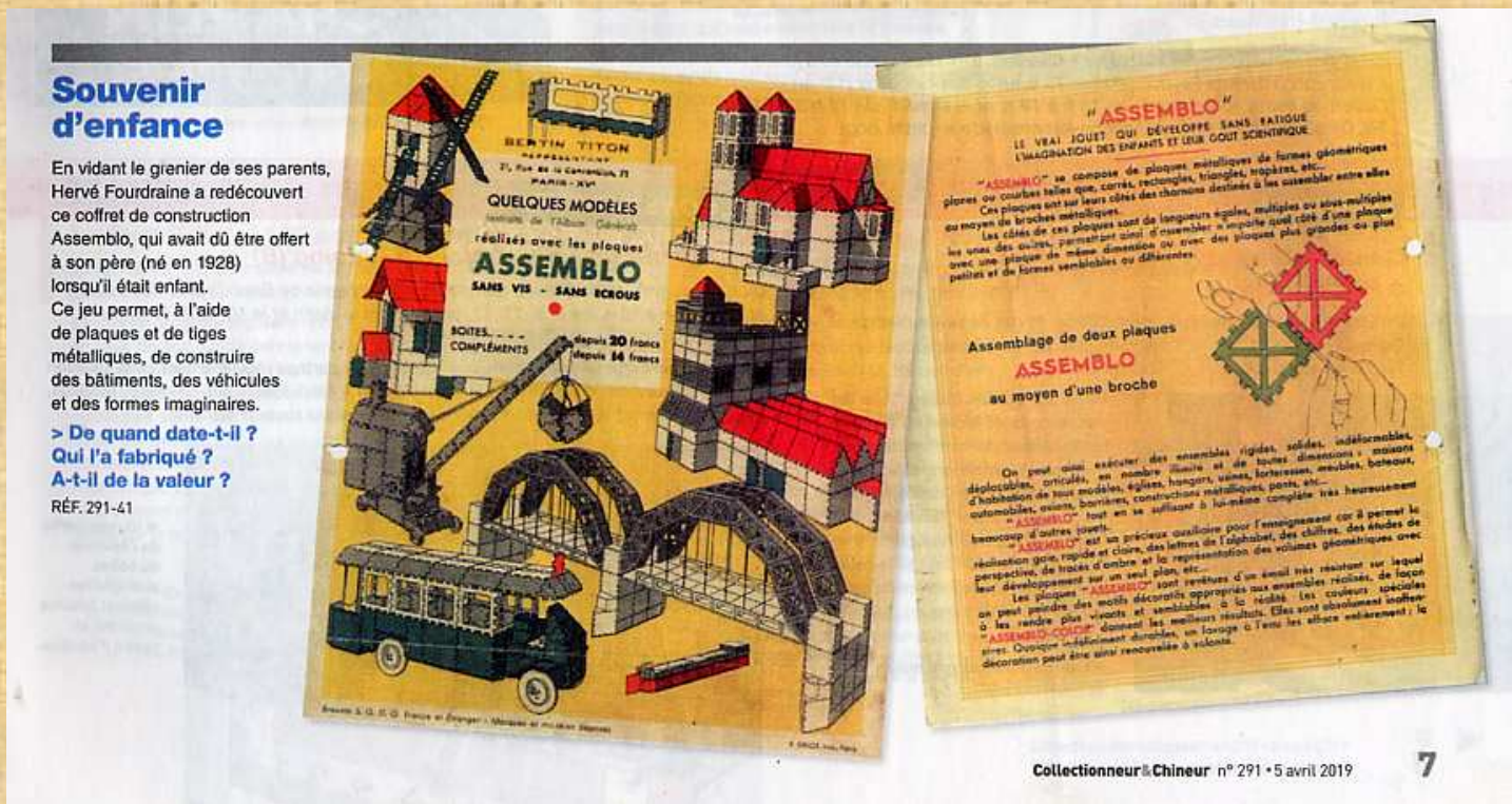
Collectionneur & Chineur n° 291 • 5 avril 2019