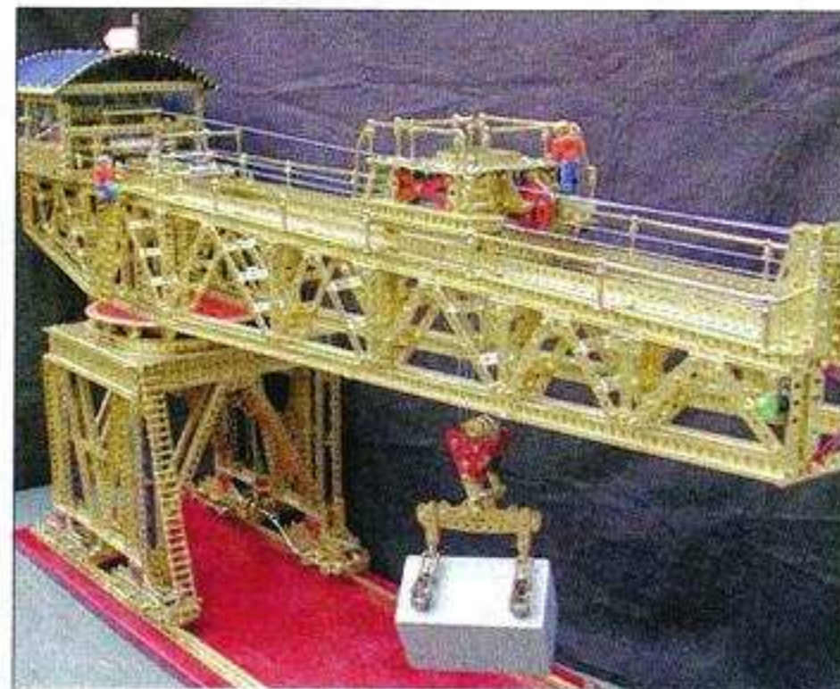
◆ Une grue à béton miniature fonctionnelle.

Au Cosec, les enfants pourront développer leur créativité lors d'ateliers de construction animés par les bénévoles du Club des Amis du Meccano durant les trois jours de l'exposition. Et pour le plaisir des yeux : un panel de modèles, des plus conventionnels aux